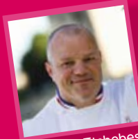
Philippe Etchebest, L'Hostellerie de Plaisance à St-Émilion